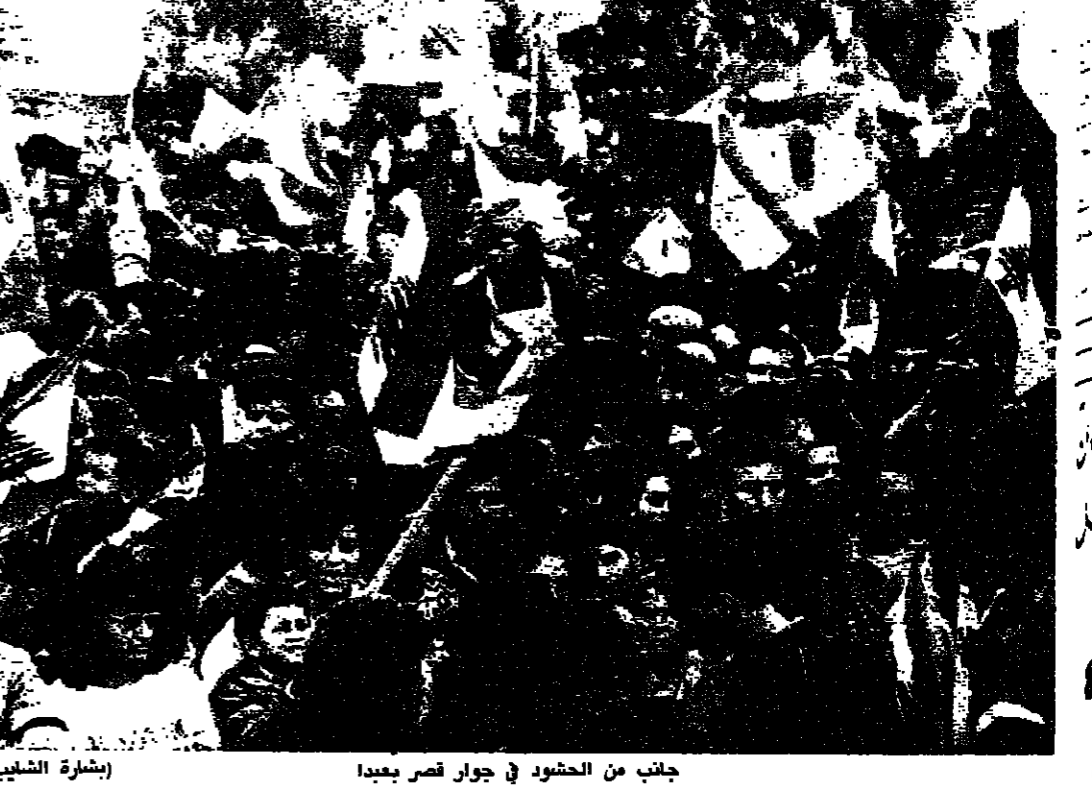
جانب من الحضور في جوار قصر بعيدا (بشارة الشاي)

الدخول الدولي في خط الأزمة اللبنانية بعد التلويح الذي صدر بامكان القيام بعمل عسكري ضد المناطق الشرقية وتحديداً قصر بعيدا، والاعتصامات الحاشدة التي قامت في المليل، المسح في الحال أمام مجالحة دولية - اقليمية منها ما هو ظاهر، ومنها ما يتم بواسطة الاقنية الديبلوماسية مع المعنيين المحليين والاقليميين، وفتح باب الوساطات لعروضات سياسية، اكد عليها جميع الاقراء.